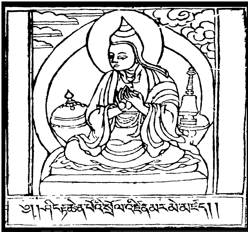
Lord Atisha (1110–1170)