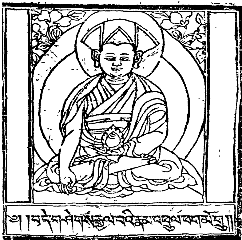
Protector Pakmo Drupa (1110–1170)