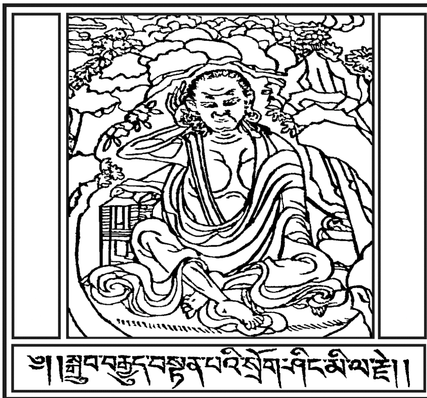
Lord of Masters, Milarepa (1040–1123)

Class Three: Empowerment and Commitments